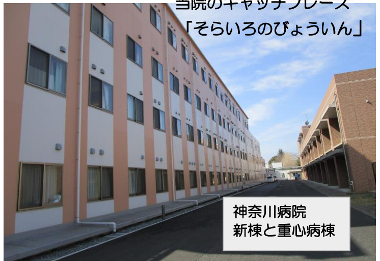
神奈川病院 新棟と重心病棟