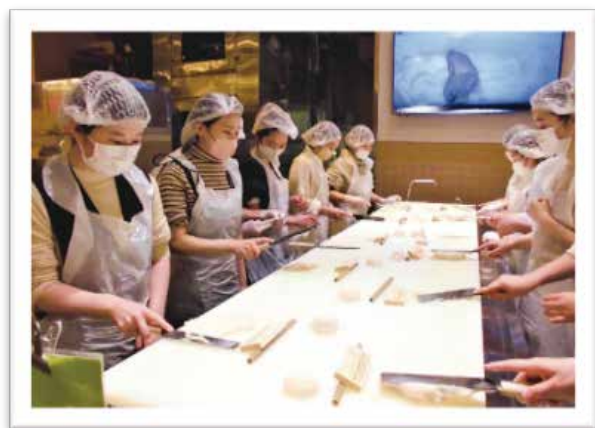
みんな初めてかまぼこを作りました