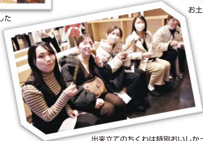
出来立てのちくわは特別おいしかったです