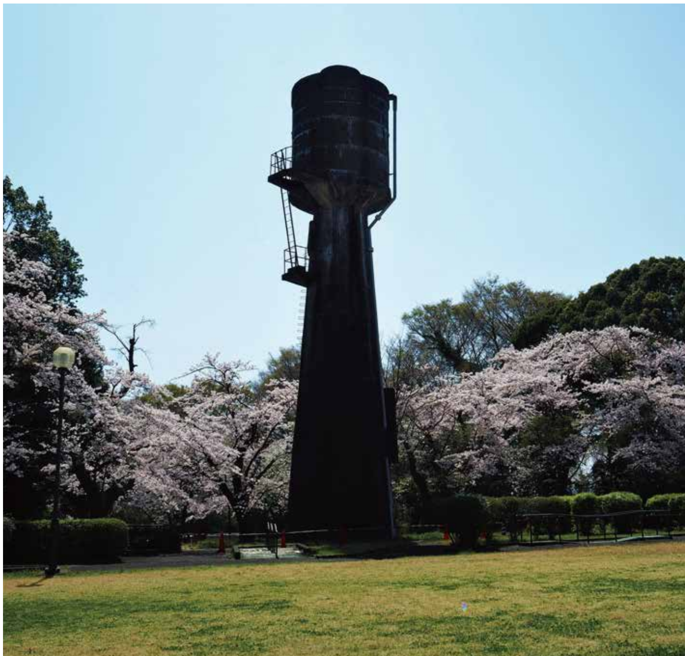
旧給水塔と桜 病院中庭より

基本理念 私たちは地域の皆様から信頼される病院づくりに努め常に新しく良質な医療の提供をします