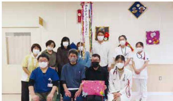
美容組合様と職員