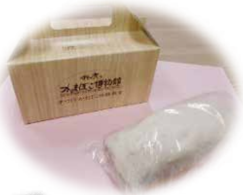
お土産のかまぼこです