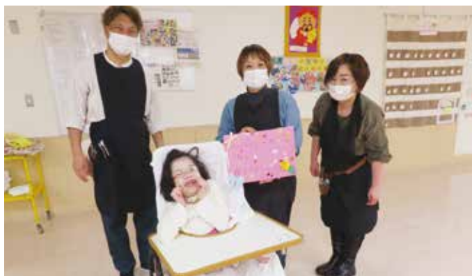
感謝をこめてお礼