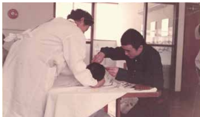
昭和48年ごろの様子