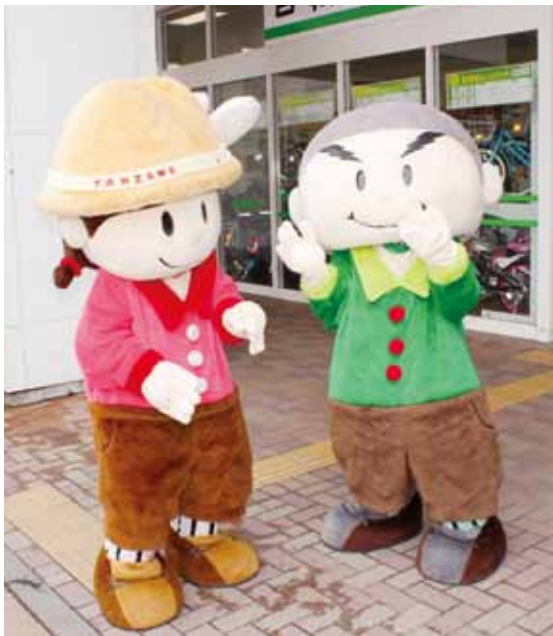
秦野市のマスコットキャラクター 大人気だった丹沢のぼる君（向かって右） とあゆみちゃん（同左）です。

本イベントの成功を受けて、イオン秦野ショッピングセンターからの要請により今年第2弾の神奈川病院健康フェスタを9月12日(土)に開催することが既に決定しています。今後も、職員一丸となり力を合わせてイベントを盛り上げ、地域住民に信頼される病院として積極的に当院をPRしていきたいと考えています。