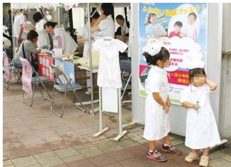
白衣体験撮影会コーナー かわいい未来のナース候補たちです。

当日の参加者は延べ220人で、日頃から気にかけているご体調の事、薬の副作用、血糖値など健康面 で何かしら悩みや不安をお持ちの方だけではなく、当日の測定結果を基に健康相談を受ける方も多く見受け られました。