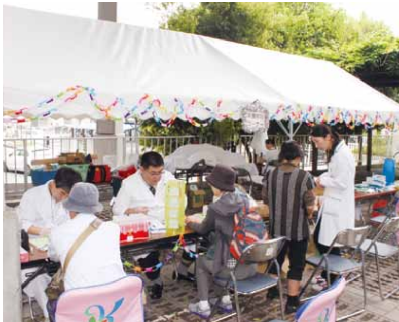
食生活診断 普段の食事の摂取カロリーや栄養のバランスを診断、適正なエネルギー摂取量を算出して、今後にお役立ていただけるようにお話ししました。