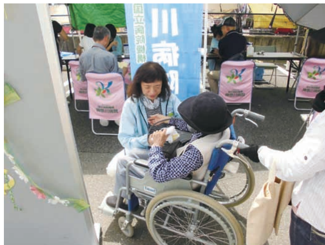
車いすの高齢者の方にもやさしく寄り添い