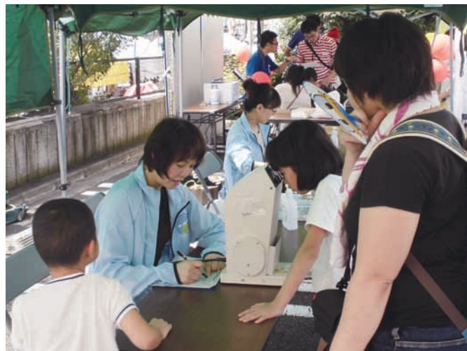
視力測定は子供たちにも人気