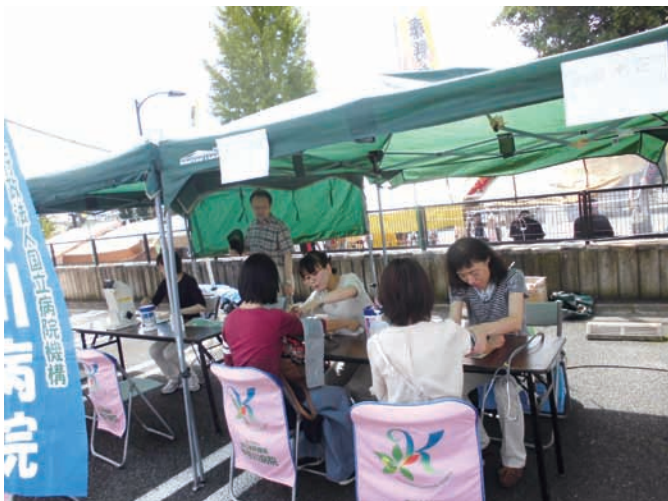
並んで血圧測定中（後ろは激励に駆けつけた院長先生）