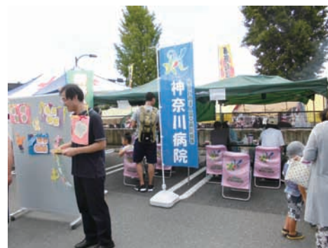
「受付」を首から下げ必死に(?)呼び込む筆者

衣を着て写真を撮れるコーナーは、今年はないの？子供が去年撮ってもらって、今年もやりたいと言うので来てみたんだけど。」とのこと。丁重にお詫びをしたうえで、来年はまた白衣体験コーナーの復活を検討させていただき旨返答申し上げました。着実に病院の認知度も上がってきているなどの感触を得るとともに、こうした未来の医師、看護師さんの卵も含めて、世代を問わず幅広く地道に病院のPRを続けていき、地域により深く根差した、市民の皆さんに一層身近な存在となれるよう努力して行かねばとの思いを強くした一場面でありました。