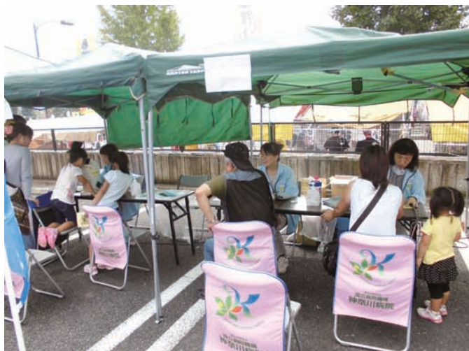
子供たちの測定姿に思わず笑顔！

11月には「秦野市市民の日」が控えています。ここでは当院の全職種が参加、一致協力してイベントを盛り上げますので、ぜひ神奈川病院のブースにお立ち寄りください、お待ちしております！